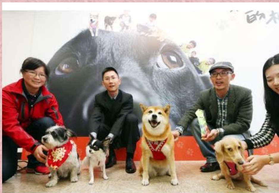
四隻獲獎的校犬(左起)：點點、小V、可樂、小安「上台合影」。