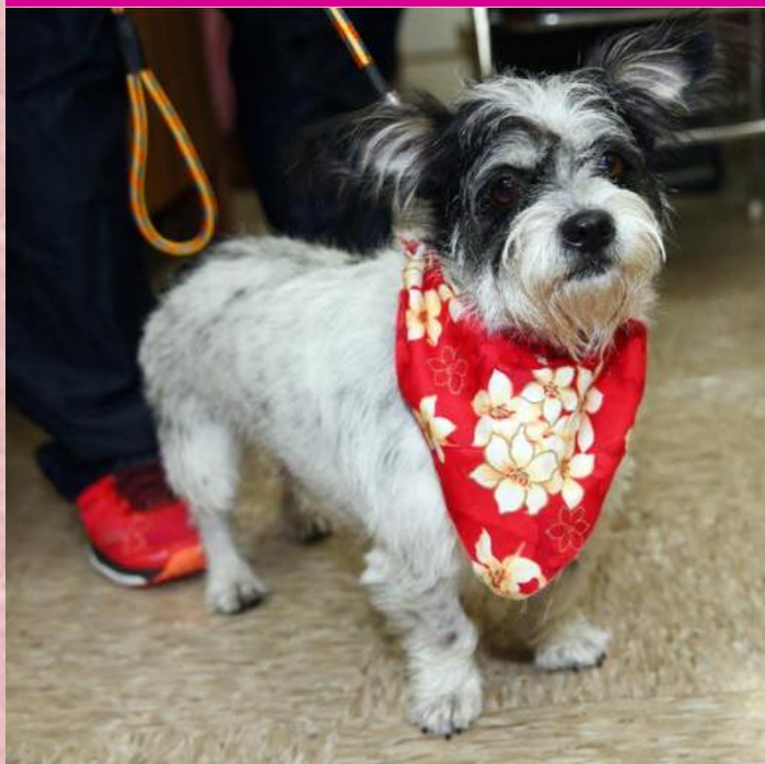
苗栗特殊學校的「點點」。